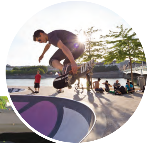
Skatepark en bord du Rhône