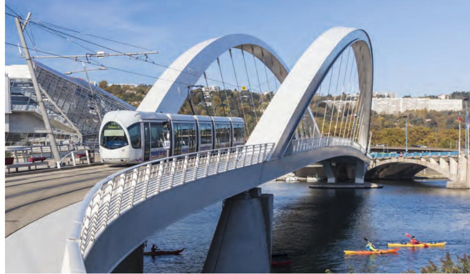
Tramway sur le pont Raymond Barre

/ + DE 100 REPRÉSENTATIONS PAR AN / + DE 580 000 SPECTATEURS ACCUEILLIS