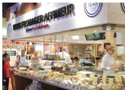
Confluence, le Cube Orange Les Halles de Lyon Tours In City, Part Dieu et sa gare TGV